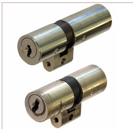
Neuer / abgenutzter Zylinder