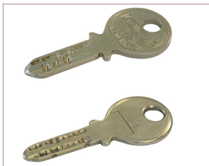
Neuer / abgenutzter Schlüssel